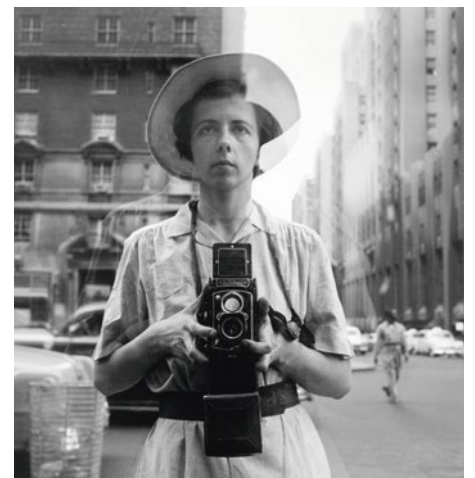
„Finding Vivian Maier“